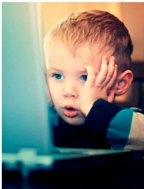
Интернет может быть опасен!

ДЕТЯМ ДО 5 ЛЕТ НЕ РЕКОМЕНДУЕТСЯ ПОЛЬЗОВАТЬСЯ КОМПЬЮТЕРОМ. ДЕТЯМ 5-7 ЛЕТ МОЖНО «ОБЩАТЬСЯ» С КОМПЬЮТЕРОМ НЕ БОЛЕЕ 10-15 МИНУТ В ДЕНЬ 3-4 РАЗА В НЕДЕЛЮ.